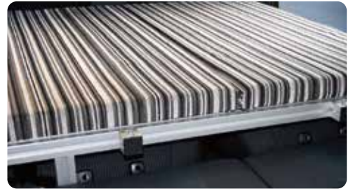
【サイズ】H2,100mm×W1,200mm ※最大幅寸法。