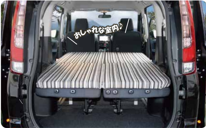
※画像は一部ヴォクシーと異なります。