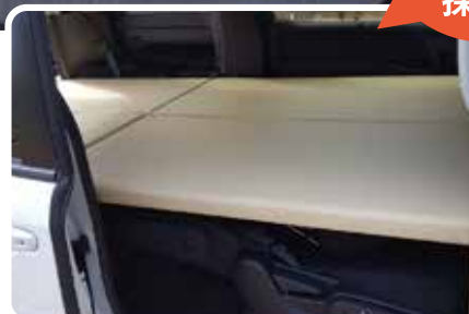
【サイズ】H2,100mm×W1,200mm ※最大幅寸法。